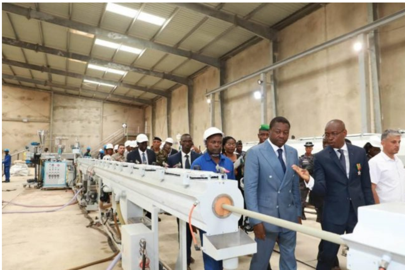
Le chef de l'Etat SEM Faure Gnassingbé visitant l'usine Africa Plastic

L'usine de fabrication de plastique, fruit d'un investissement de 15 Milliards de Francs CFA, est une unité industrielle de transformation du polychlorure de vinyle (PVC) en vue de la fabrication de divers tuyaux. Il s'agit des tubes PVC d'assainissement, des tubes PVC d'évacuation, des tubes PVC de forage et des tubes PVC d'irrigation. Elle contribuera à créer près de 200 emplois directs et 500 emplois indirects.