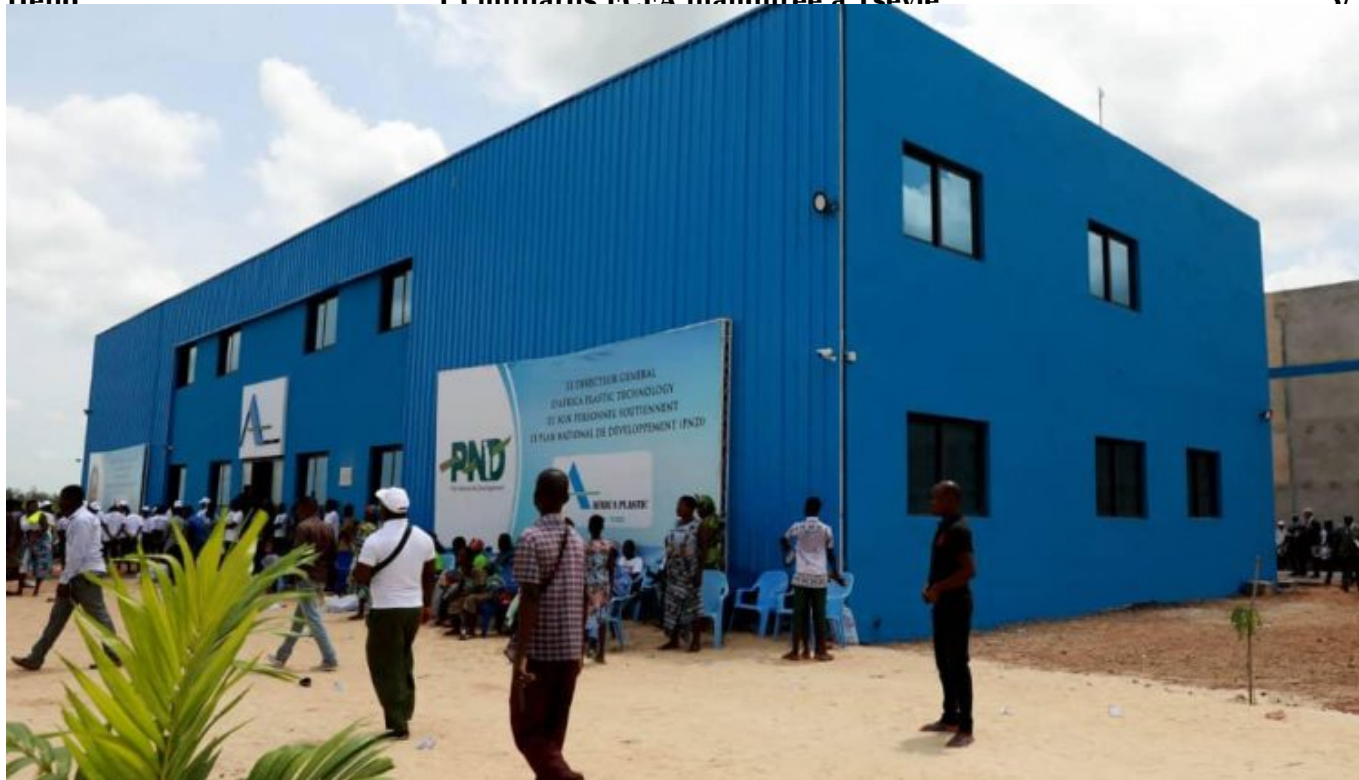
Une vue de l'usine Africa Plastic à Tsévié

Selon les promoteurs, le climat des affaires favorable aux entreprises à vocation exportatrice, la disponibilité d'une main d'œuvre qualifiée et la qualité des infrastructures portuaires et aéroportuaires sont les conditions qui ont permis de choisir le TOGO comme destination.